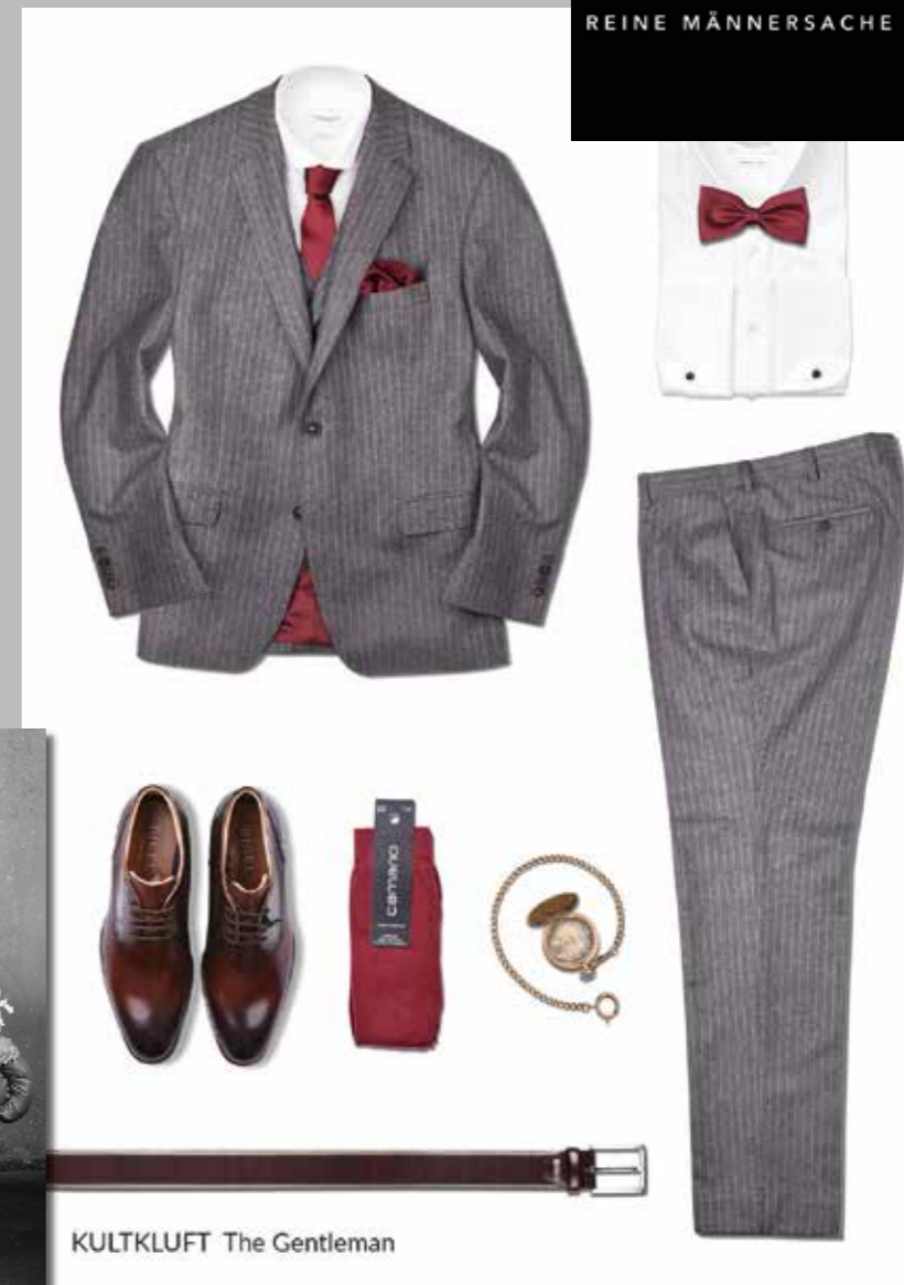
KULTKLUFT The Gentleman

Der ebenso elegante wie robuste Stoff aus England ist einer der modischen Highlights dieser Saison. Natürlich bekommst Du ihn bei uns - auf Wunsch gerne auch „auf den Leib geschneidert“. Solltest Du nicht der „Very British“ Typ sein, wirst Du von unserer Auswahl an individuellen, urbanen und nachhaltigen Outfits begeistert sein. Wir freuen uns darauf, Dich und Deine Begleitung in gehillter und familiärer Atmosphäre beraten zu dürfen. Bei Hochzeits- und Maßanzügen vereinbare bitte vorab einen Termin mit uns.