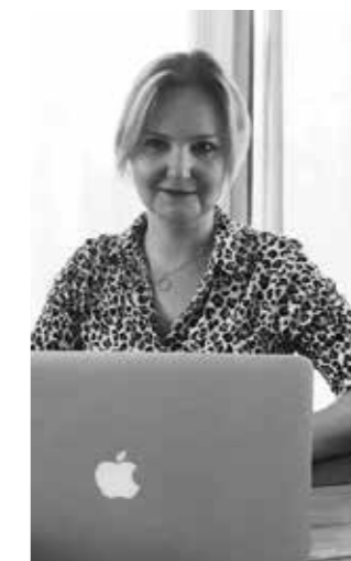
DOROTHEE ZENGLEIN Grafik und Layout des Brautführers